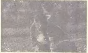
Из штрафной «горячо»

Тогда Алимов пошел на занятия скорее по обязанности. Но судья