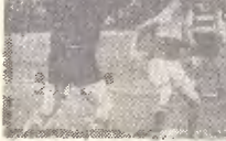
Дублиры «Спартак» во время учебного сбора в Ялу поперлись киломи с командой мелитопольского «Буковестина». Матч закончился ничью — 0:0.

1948, 1949, 1957, 1961 гг. третьи места. В остальных чемпионатах команда занимала места: 1945 г. — десятое, 1946 г. — шестое, 1947 г. — восьмое, 1950 г. — пятое, 1951 г. — шестое, 1956 г. — шестое, 1960 г. — седьмое.