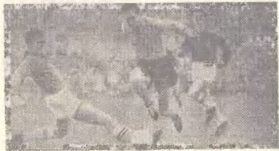
Кубок Европы. Игроки команд Голландии и Швейцарии.

Команды, стоящие в этом списке первыми, сначала принимают у