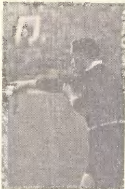
Мяч на центрі

зициях. Арбитр — на поле. Зритель — на трибуне. Не секрет, что на больших стадионах игра смотрится с первого ряда и с последнего по-разному. К тому же с верх-