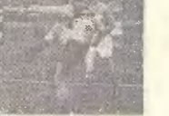
Дублиры «Спартак» во время учебного сбора в Ялу поперлись киломи с командой мелитопольского «Буковестина». Матч закончился ничью — 0:0.

1952 г.: В. Чернышев, Ю. Костиков, В. Фоккин, И. Тищенко, Т. Бедов, Ю. Седов, И. Нетто, О. Тимков, А. Парамонов, Н. Паршин, Н. Симонян, Н. Деметьев, А. Изь-