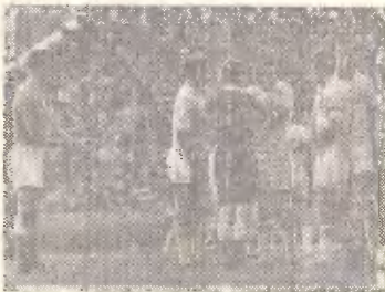
— Товарищи, кляной!

Судья — первый помощник футболиста и зрителя. Не случалось, чтобы он первым выходит и на поле. Только он может дать сигнал к началу игры, той самой, ради которой мы с вами спешим на стадион.